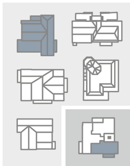
HAUS 1 | 2. OG Wohnung 05