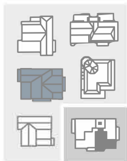
HAUS 4 | 1. OG Wohnung 06