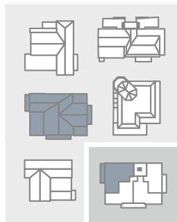
HAUS 4 | 1. OG Wohnung 08